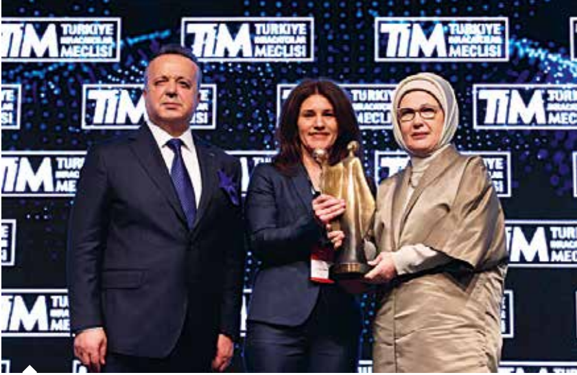
Başarılı kadın ihracatçılara ödülleri takdim eden Emine Erdoğan, kadınların, büyüyen ülke ekonomisine güçlü katkısına şahit olmanın büyük gurur kaynağı olduğunu söyledi.

Ticaret Heyetleri düzenledik. Women Export Talks etkinliklerimizde, ihracatımıza değer katan kadın ihracatçılarımız, tüm kadınlara ilham olacak başarı hikâyelerini anlattı. Kadın Girişimci Tecrübe Programlarımızla, TİM-TEB Girişim Evlerinde 170 kadın girişimciye mentorlük verdik. Girişim Evlerimizdeki Kadın girişimcilerimiz, 60 milyon lirayı aşkın yatırım aldı. Bununla beraber, Kuzey Kıbrıs'ta kadın ve genç girişimcilere yönelik eğitim programları gerçekleştirdik. Ayrıca ABD büyükelçiliği iş birliği ile ülkemizde ilk kez Kadın Tekno Girişimci programı düzenledik. Desteklediğimiz kadın girişimcilerimiz, bugün onlarca ülkeye ürün ve hizmet ihraç ediyor. Aralarında yeni nesil elektrikli bisiklet üreten de zeytin atıklarını geri dönüştürüp bio-plastik üreten de Türkiye'nin ilk ve tek yerli propolis tesisini kuran da var. Türkiye İhracatçılar Meclisi olarak kadın girişimcilerimizi desteklemekten gurur duyuyoruz. Çünkü inanıyoruz ki ihracatla yükselen Türkiye'nin mimarı kadınlarımız olacaktır." dedi.