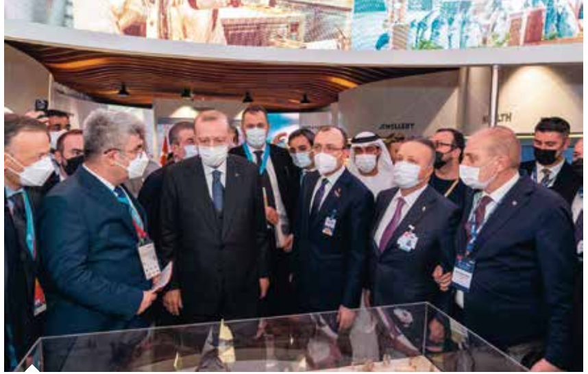
Cumhurbaşkanı Recep Tayyip Erdoğan ve Ticaret Bakanı Mehmet Muş, Dubai Expo Türkiye Ulusal Günü etkinlikleri kapsamında sergi alanındaki stantları ziyaret etti.

Söz konusu sektörlerin iş takipleri ve ilişkileriyle hedeflenen 10 milyar dolarlık ihracat hedefine ulaşılmasının çok zor olmadığını kaydeden Başkan Gülle, "Birleşik Arap Emirlikleri dünyadan 245 milyar dolar ithalat yapıyor. Yurt dışından 1.275 ürün alıyor. Biz de bu ülkeye 1.275 ürünün 980'ini satıyoruz. Ayrıca Birleşik Arap Emirlikleri'nin Türkiye'den ithal edebileceği 317 ürün daha tespit ettik. Birleşik Arap Emirlik-