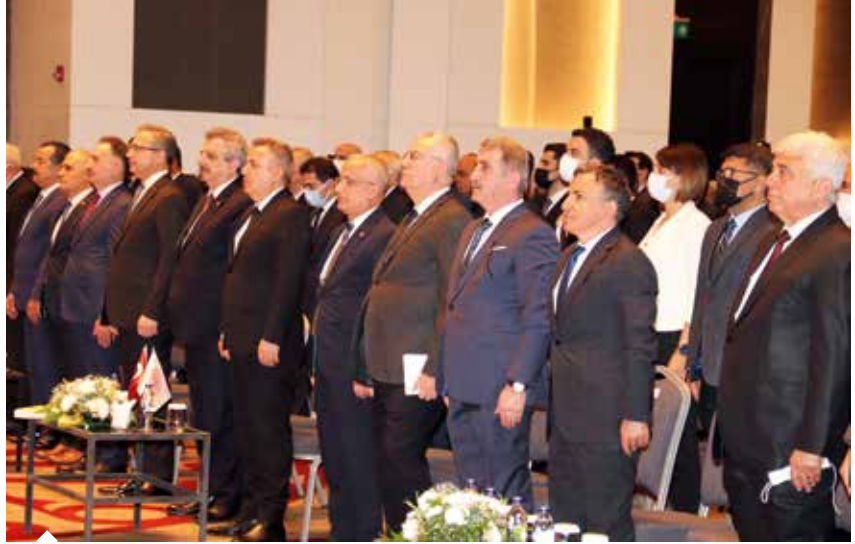
Tarımdan savunma sanayine, otomotivden inşaata, tüketici ürünlerinden ilaç ve sağlık sektörüne hemen her alanda Türkiye ekonomisine önemli katkılar sağlayan kimya sektöründe geleceğe yönelik stratejilerin değerlendirildiği toplantıya iş dünyası büyük ilgi gösterdi.

Dünya genelinde kimya sektöründe 2020 yılı verilerine göre 3,4 trilyon avroluk pazar bulunduğunu, bu endüstrinin Türkiye ekonomisi için de stratejik öneme sahip olduğunu dile getiren Başkan Kıvanç, “Türkiye’nin lokomotif sektörlerinden kimya sanayi, pek çok sektöre ara mal ve ham madde temin eden bir sanayi dalı olarak gerek üretim, gerekse dış ticarete ülke ekonomisine büyük fayda sağlıyor. Ülkemizin büyümesinde öncü rol oynayan, 16 alt sektörüyle birlikte ekonomide stratejik görev üstlenen kimya sektörümüz, 2021 yılında gerçekleştirdiği 25,4 milyar dolar ihracat ile rekor kırmıştır.” dedi.